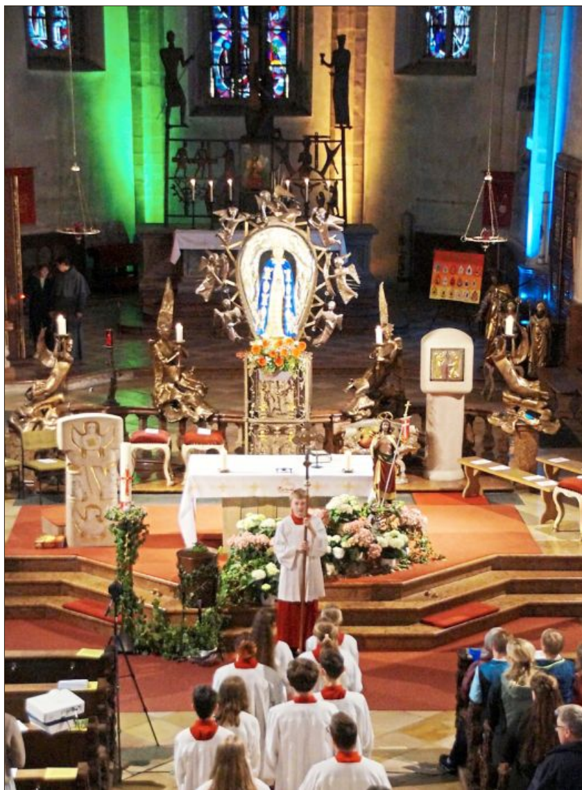
Voran zogen die Bogener Ministranten in die Marienkirche ein.