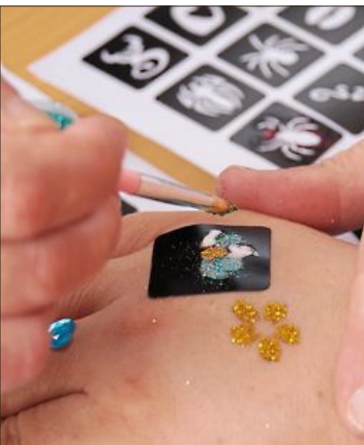
Bei der Wohngemeinschaft Sankt Hildegard gab es Glitzertattoos.